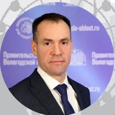
ЖЕСТЯННИКОВ СЕРГЕЙ ГЕННАДИЕВИЧ Заместитель Губернатора Вологодской области